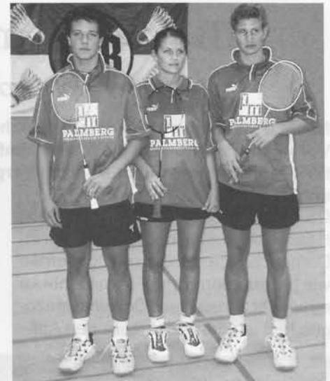
Die "Neuen" im Dress des Oberligisten VfB Lübeck

der Vorbereitung steht. Mit diesem Ergebnis ist der Trainer allerdings sehr