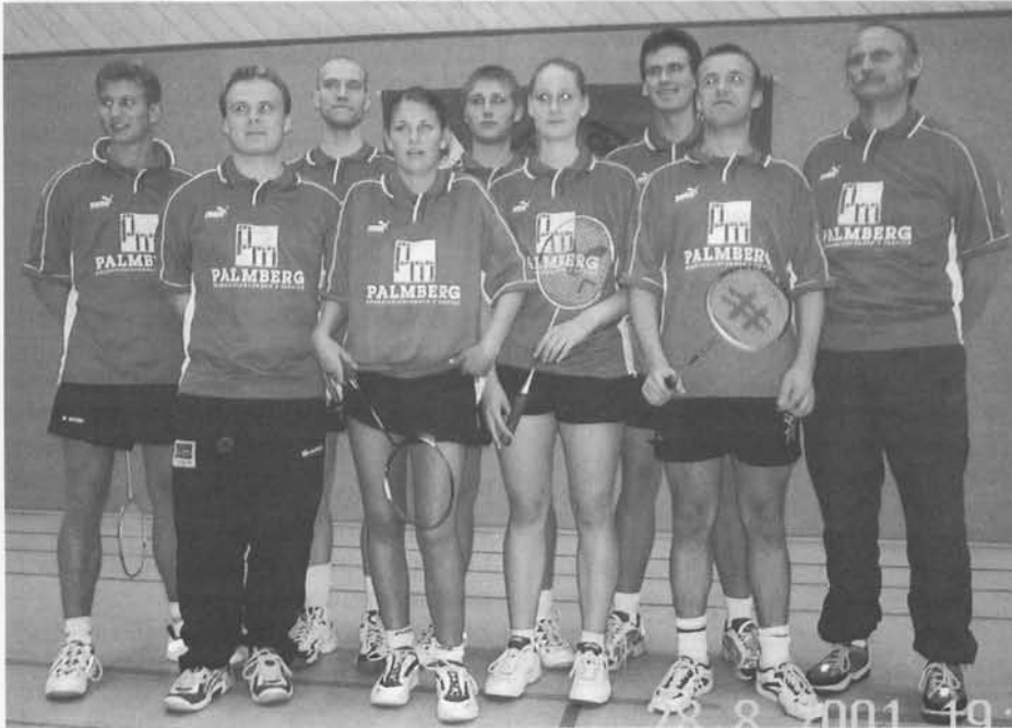
Das ist die Mannschaft, die in der neuen Saison in der Oberliga oben mitspielen und um die Titelvergabe mitreden will

zufrieden, insbesondere auch mit der hohen Motivation der Spieler.